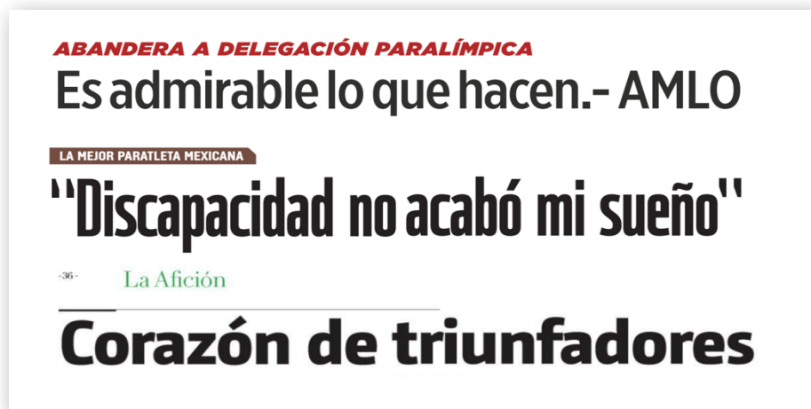
Figura 3. Ejemplo de encabezados destacando la superación