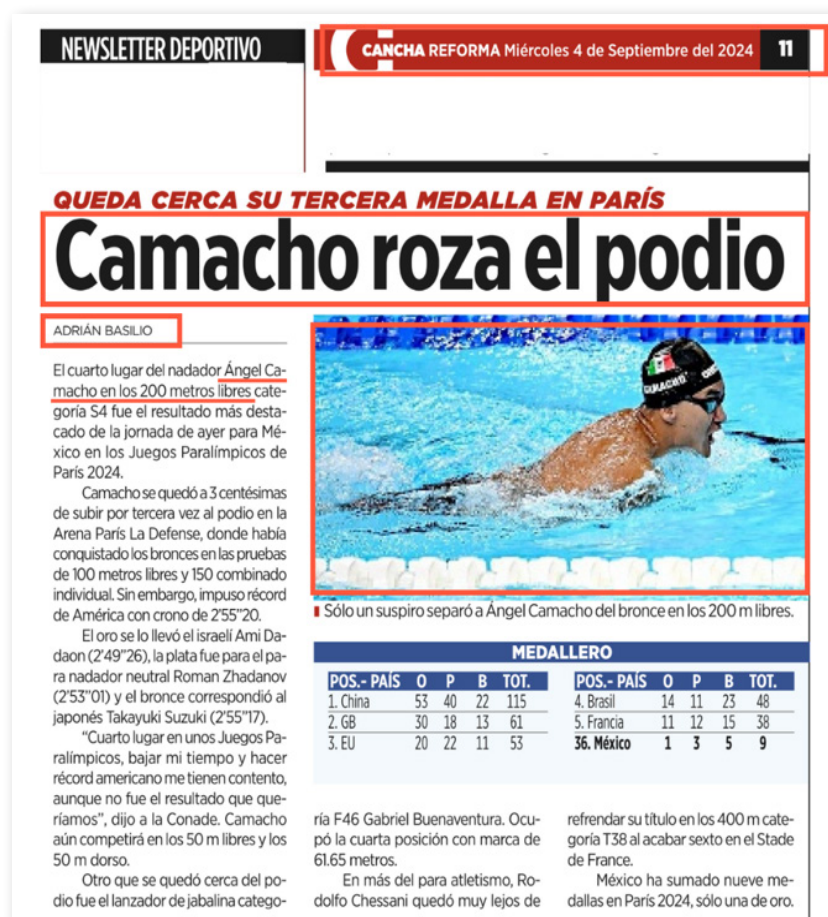
Figura 1. Ejemplo del contenido analizado en las notas periodísticas.