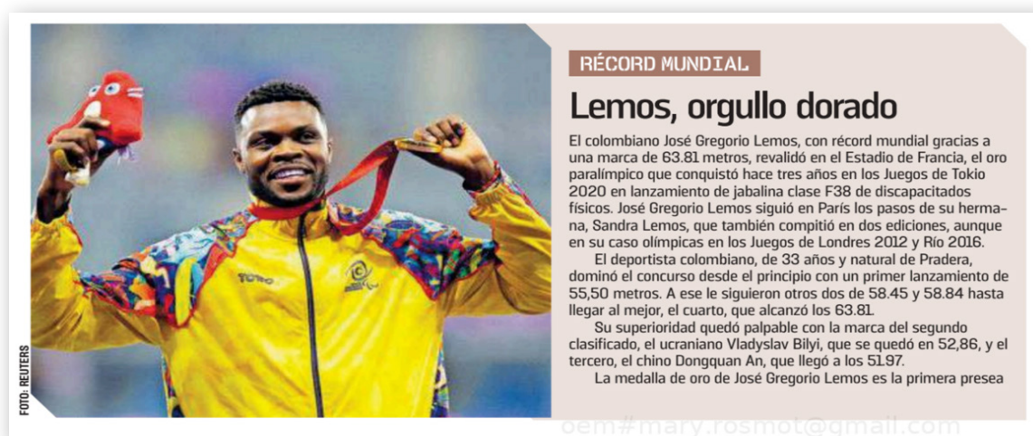
Figura 7. Nota periodística de José Gregorio Lemos