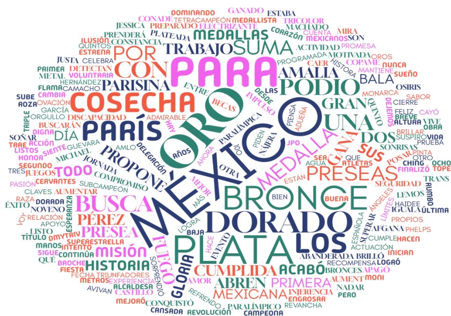
Figura 2. Nube de palabras de los encabezados de las notas revisadas